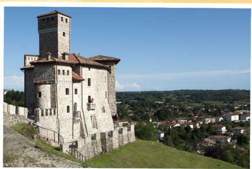
Castello Savongnan - Artegnana