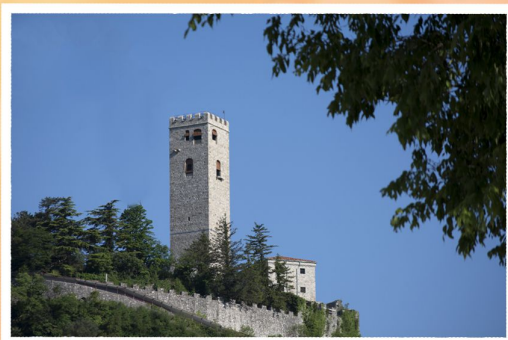
Castello di Gemona del Friuli